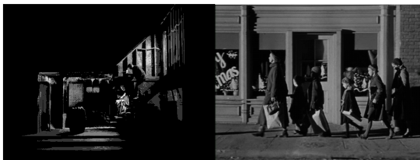
A gauche : Powell poussant les enfants dans la cave.

En effet, la règle de base du film semble résider dans le contraste et l'opposition. On peut immédiatement le remarquer avec ce choix de Charles Laughton de faire ce film en Noir & Blanc accentuant le contraste, mettant en lumière les différences jouant sur les ombres et les zones claires.